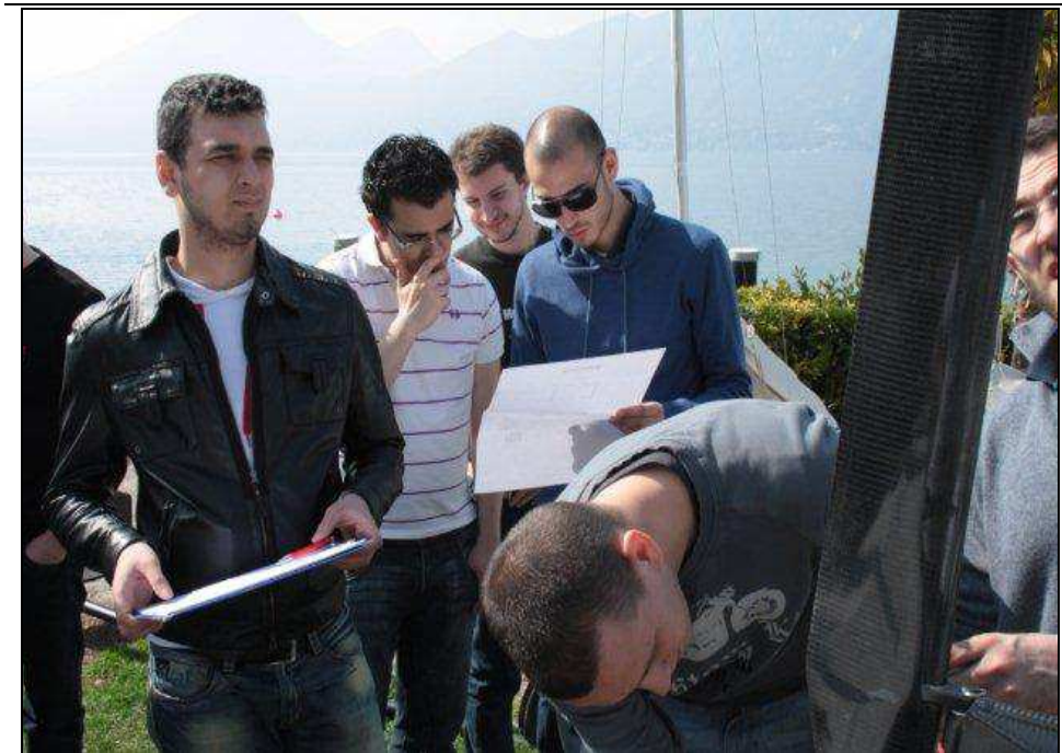
Controllo montaggio pinne