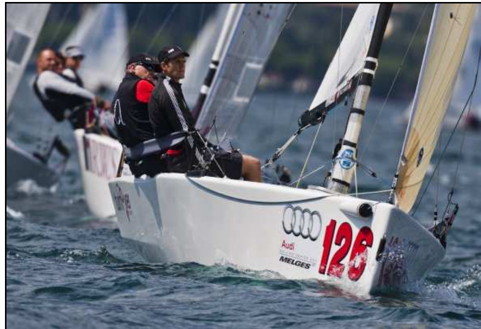
Competizioni organizzate dai circoli nautici