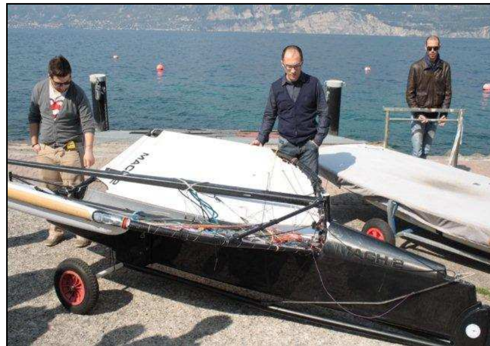
Visiona tura dell’imbarcazione da assemblare