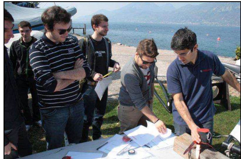
Lettura dei disegni