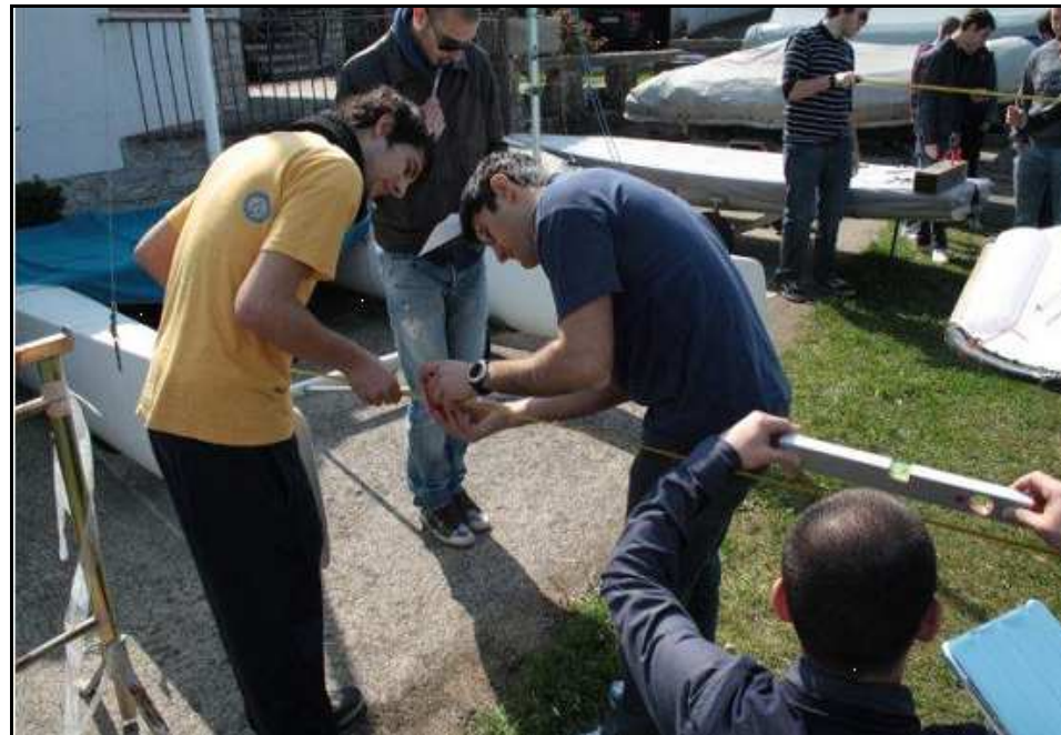
Tecniche di misurazione