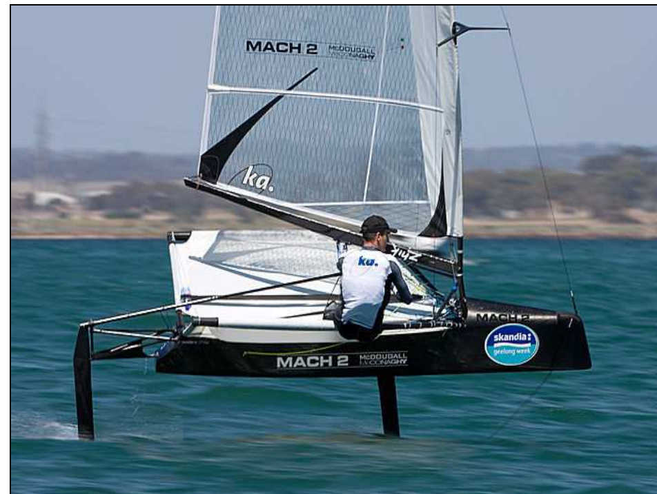
Tipica imbarcazione classe “Moth” sollevata rispetto al pelo dell’acqua