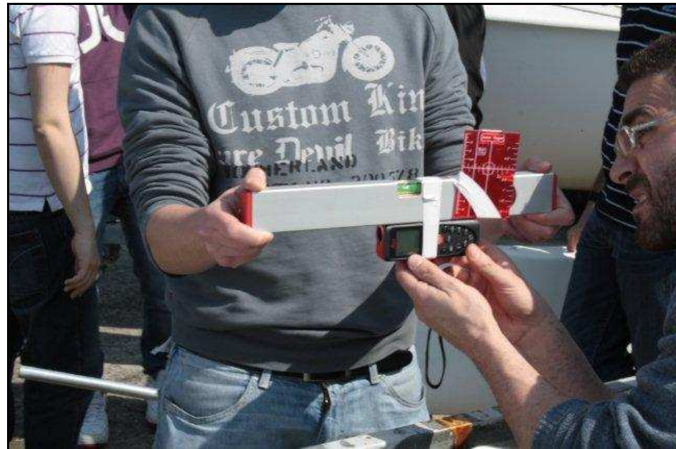
Misurazione con strumentazione laser