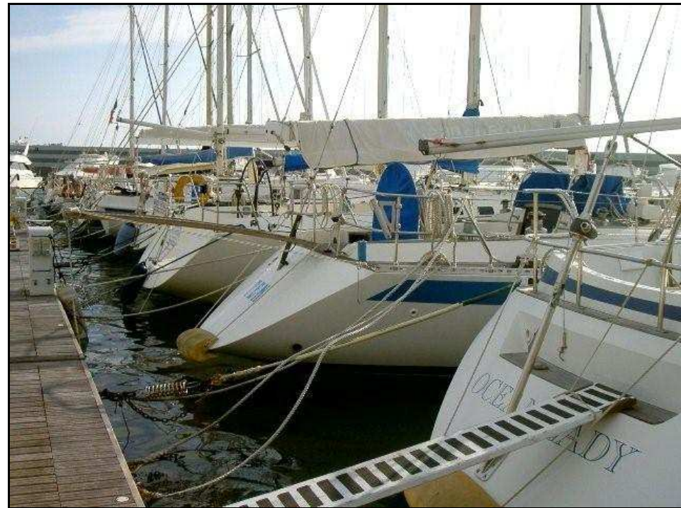
Servizio di parcheggio in un circolo nautico